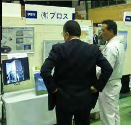
熱心に製品等の説明を聞く入場者