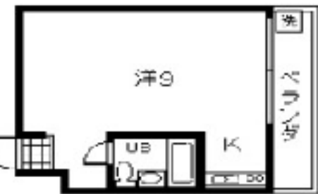
■306・307 (南向きベランダ) ※307は反転タイプ