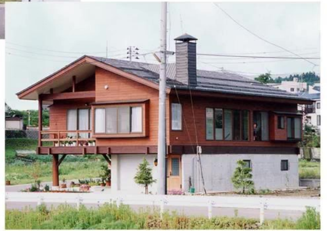
北東の角地からのたたずまい