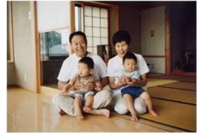
リビング脇の和室で 遊びに来た姪の双子の子供と くつろがれるご夫婦