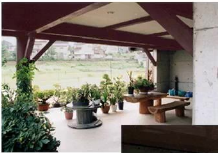
ピロティ前の お花畑のご夫婦