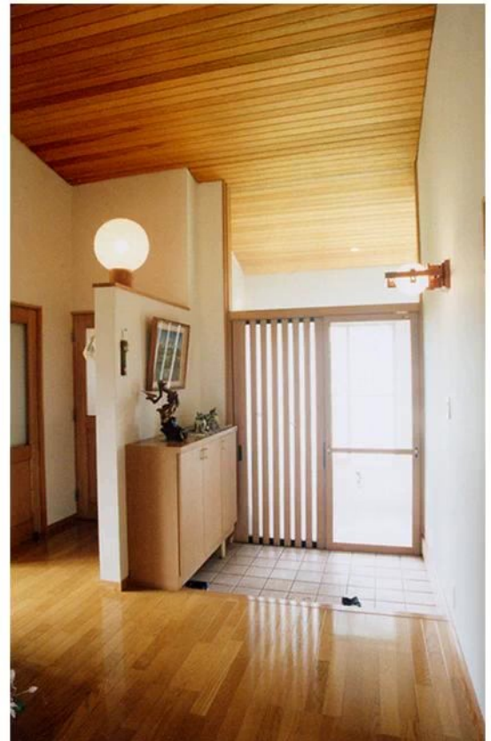
玄関ホールと サニタリーへの アルコーブ