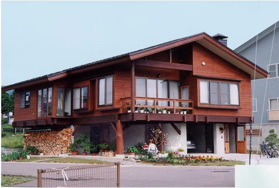
南東の角地からのたたずまい