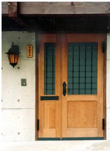
1階出入口ドア (正玄関は2階)