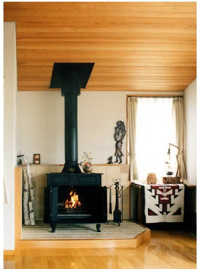
フランクリン型 素朴な暖炉