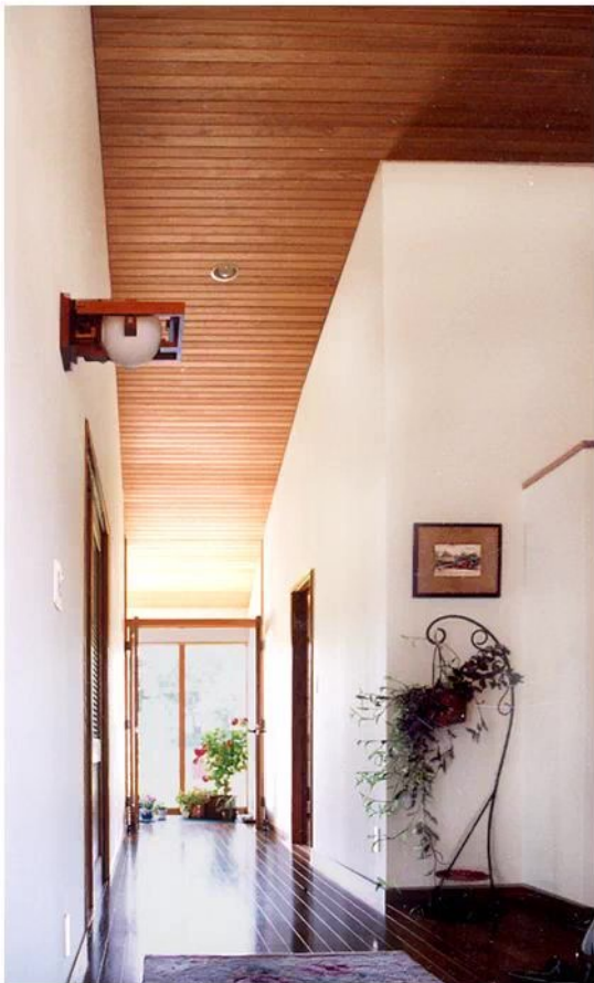
玄関より廊下奥のサンルーム