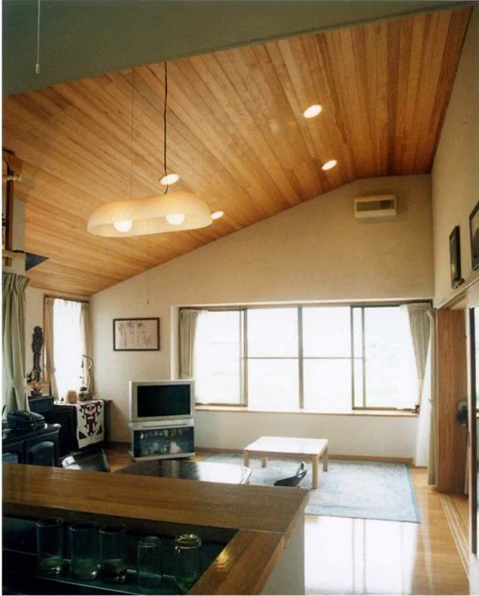
キッチンよりダイニングリビング