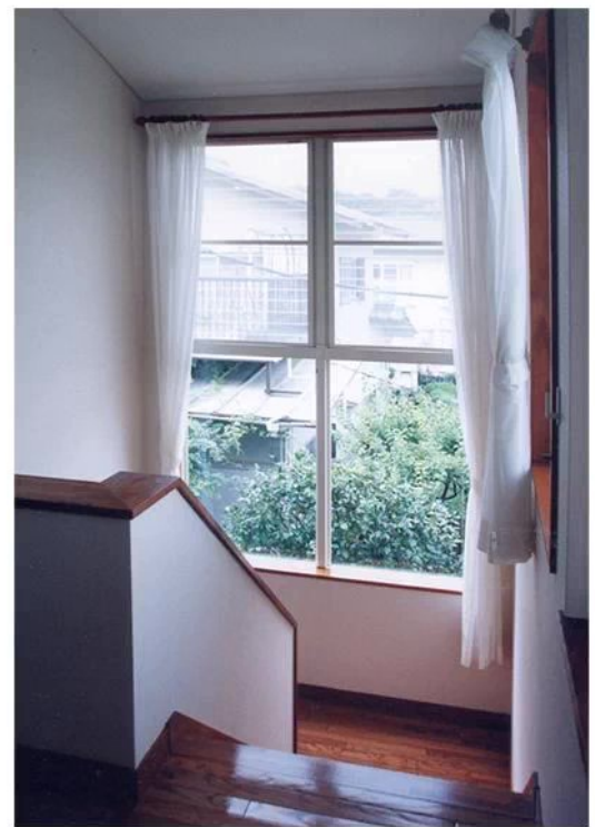
北側の明るい階段