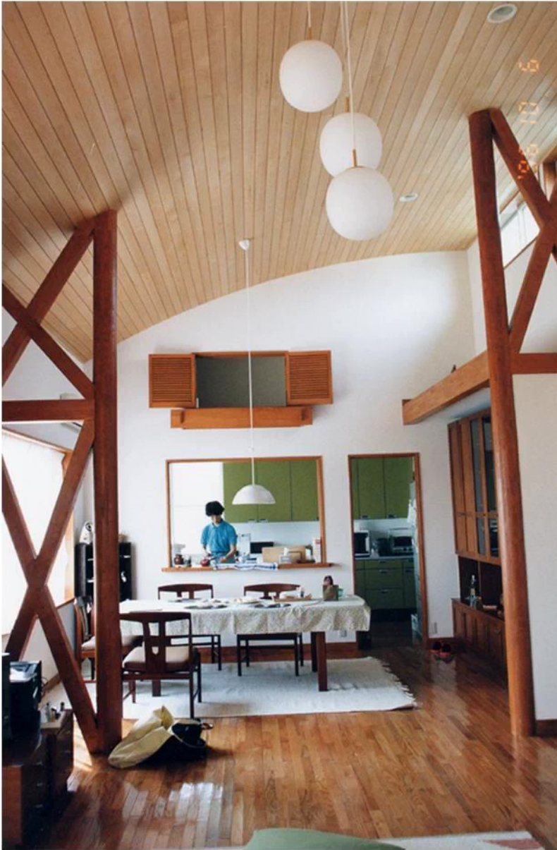
2階の見晴らし良い場所に設けたダイニングから キッチンと上のロフトを見る 集成材の梁による屋根の局面をそのまま現した青森ヒバの天井