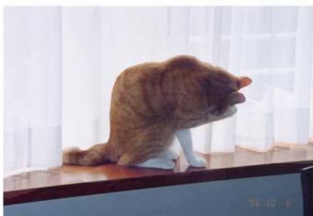
ダイニングの出窓で日向ぼっこ