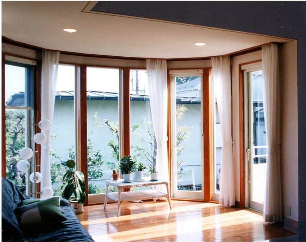
リビングから円形にふくらんだ2階のサンルーム