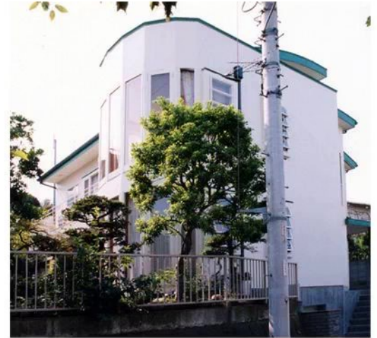
道路より見上げた東南のたたずまい