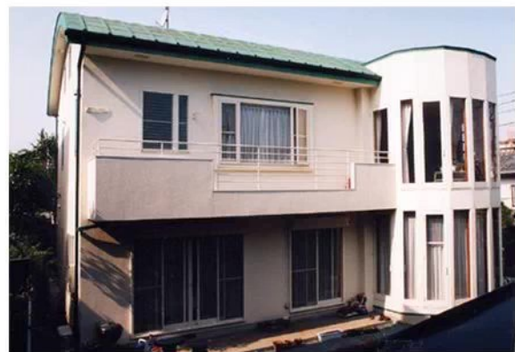
南側の外観 1階は個室 (2階は左より台所、中央はダイニング 右側はダイニングにより連続し、円形にふくらんだリビングスペース