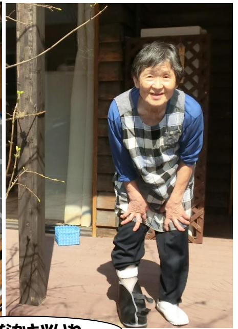
なかなかキツイわ