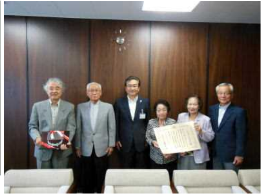
石森市長と一緒に