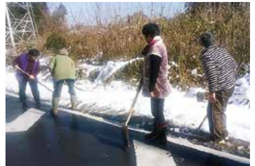
明日は、筋肉痛に悩まされそう