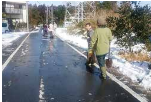
通学路が、きれいになりました