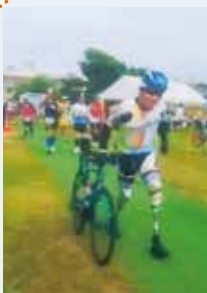
現役バリバリ(古い)の雄姿

現在、京都マラソン応援大使に就任、マラソン・トライアスロン・講演活動など、まだまだ挑戦を続けていく姿に私も元気をもらいました。