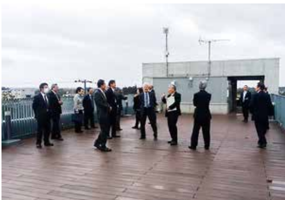
一松北部コミュニティセンター

東京都西多摩郡「瑞穂町・奥多摩町・檜原村」 島「大島町・八丈町・利島村・三宅村・御蔵島村・青ヶ島・小笠原村」