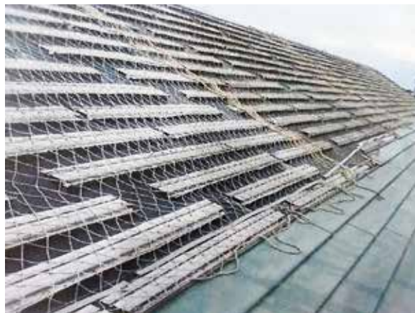
1月9日当時の現況写真

調停済み事案として「一事不再理」の扱いになる可能性としては、今回の提訴について、弁護士の見解では、前回の論点以外で施工不良を立証することで「起訴可能」と判断した。ただし、一事不再理と判断される可能性もゼロではないことから、前回で争点となった内容を除外して裁判を維持していくことになる。今後は、徹底した調査に基づき、前回と異なる瑕疵の内容をもつてすれば、前回の訴訟物とは異なる個別の訴訟物であり、和解合意によって妨げられるものではない旨の主張をすることは十分に可能であるとのこと。