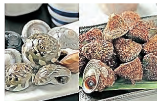
希少貝ながらみ・シツカ 食べくらベセット