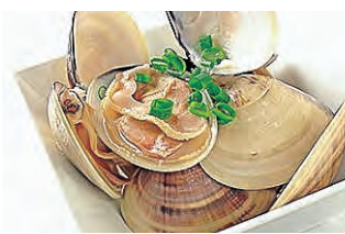
完全天然ハマグリ (ボイル)