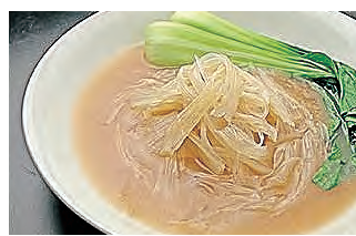
フカヒレぶつぎり 煮込み