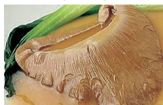
フカヒレ特大姿煮 (50食限定)