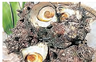
千葉県産サザエ (ボイル)