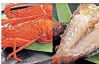
伊勢海老ボイル・干物 セット